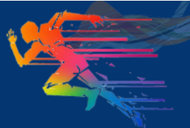
Tablo 7. Milli kontenjanına başvuru için kabul edilecek olimpik spor branşları